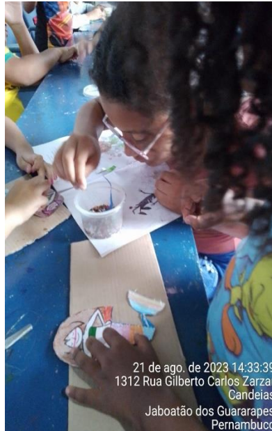
21 de ago. de 2023 14:33:39 1312 Rua Gilberto Carlos Zarzar Candeias Jaboatão dos Guararapes Pernambuco