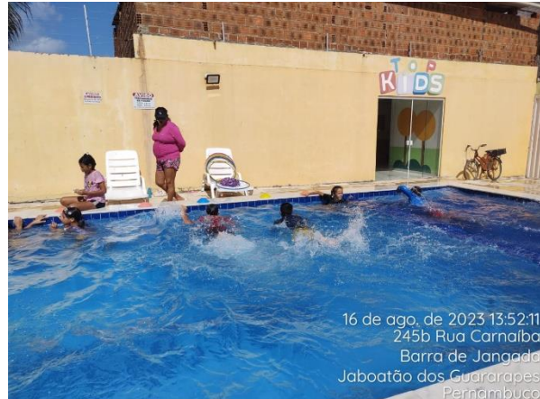
16 de ago. de 2023 13:52:11 245b Rua Carnaíba Barra de Jangada Jaboatão dos Guararapes Pernambuco