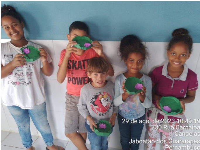
29 de ago. de 2023 10:49:19 730 Rua Carnaíba Candeias Jaboatão dos Guararapes Pernambuco