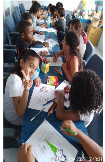
21 de ago. de 2023 13:43:31