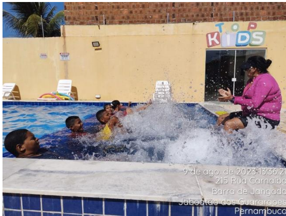
9 de ago. de 2023 13:36:21 215 Rua Carnaíba Barra de Jangada Jaboatão dos Guararapes Pernambuco