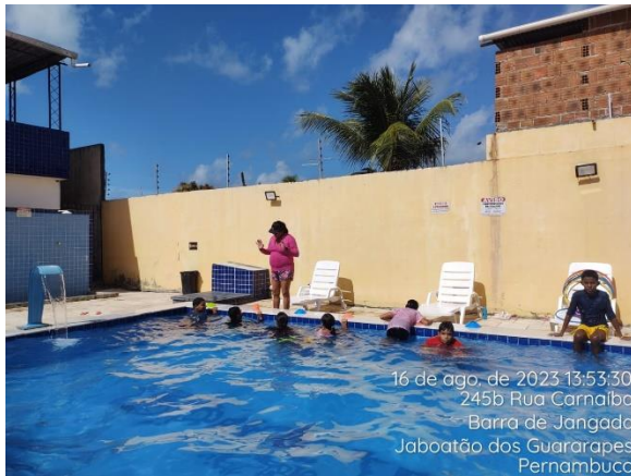
16 de ago. de 2023 13:53:30 245b Rua Carnaíba Barra de Jangada Jaboatão dos Guararapes Pernambuco