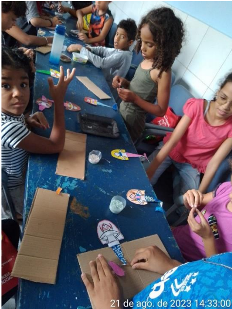
21 de ago. de 2023 14:33:00