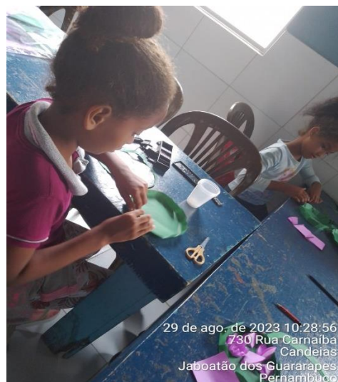
29 de ago. de 2023 10:28:56 730 Rua Carnaíba Candeias Jaboatão dos Guararapes Pernambuco