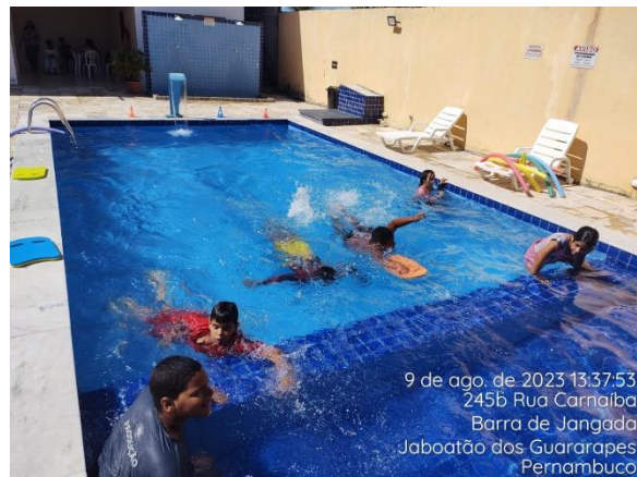
9 de ago. de 2023 13:37:53 245b Rua Carnaíba Barra de Jangada Jaboatão dos Guararapes Pernambuco