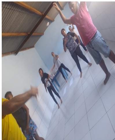
Acolhida e Escuta