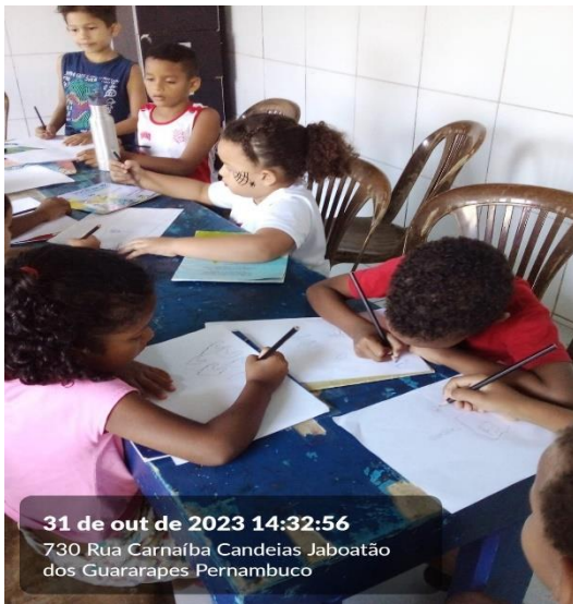
31 de out de 2023 14:32:56 730 Rua Carnalba Candeias Jaboatão dos Guararapes Pernambuco