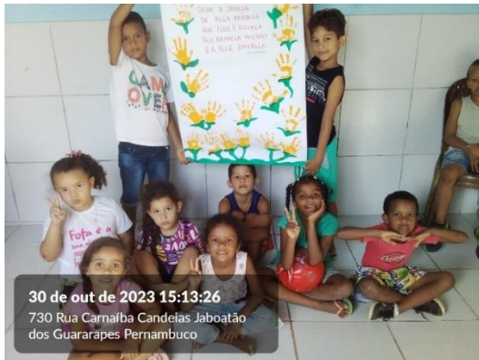
30 de out de 2023 15:13:26 730 Rua Carnalba Candeias Jaboatão dos Guararapes Pernambuco