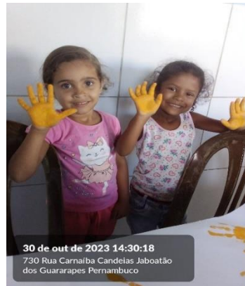
30 de out de 2023 14:30:18 730 Rua Carnalba Candeias Jaboatão dos Guararapes Pernambuco