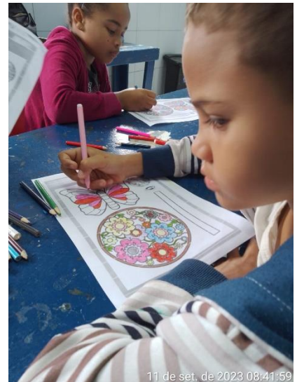
11 de set. de 2023 08:41:59