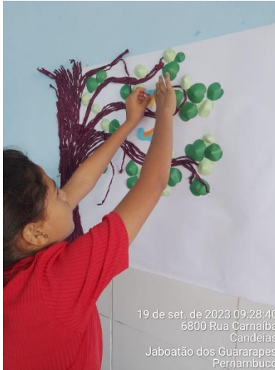
19 de set. de 2023 09:28:40 6800 Rua Carnaíba Candeias Jaboatão dos Guararapes Pernambuco