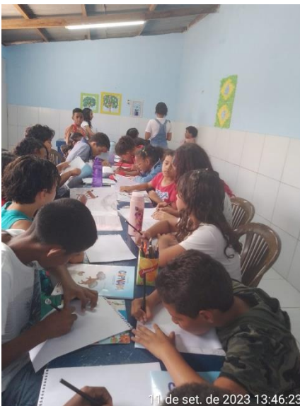
11 de set. de 2023 13:46:23