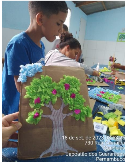
18 de set. de 2023 08:52:25 730 Rua Carnaíba Candeias Jaboatão dos Guararapes Pernambuco