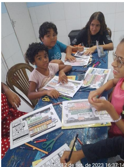
12 de set. de 2023 16:37:14