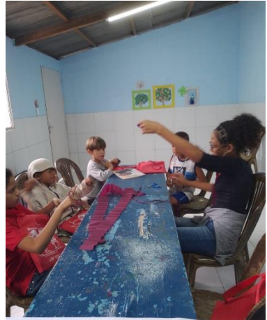
19 de set. de 2023 07:37:58