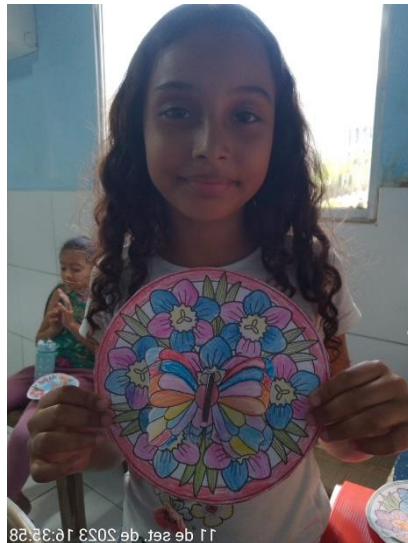
11 de set. de 2023 16:32:28