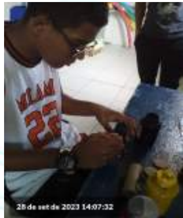
28 de set de 2023 14:07:32