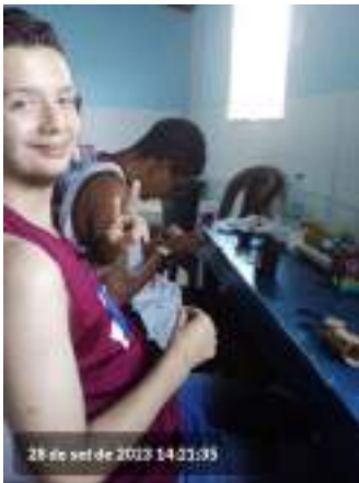
28 de set de 2023 14:31:35