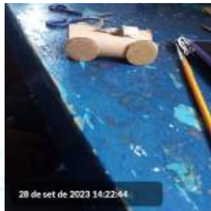
28 de set de 2023 14:22:44