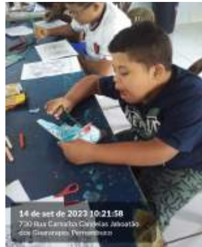
14 de set de 2023 10:21:58 730 Rua Carlos Chagas Jaboatão dos Guararapes Pernambuco