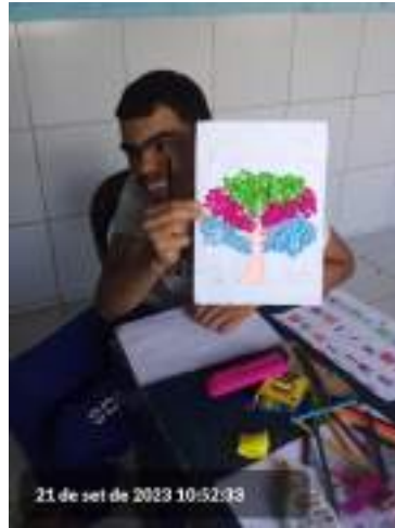
21 de set de 2023 10:52:33