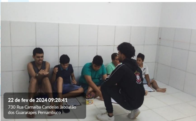
22 de fev de 2024 09:28:41 730 Rua Carnalba Candeias Jaboatão dos Guararapes Pernambuco