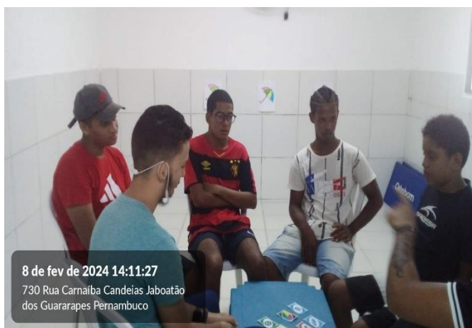
8 de fev de 2024 14:11:27 730 Rua Carnalba Candeias Jaboatão dos Guararapes Pernambuco

Através de jogos e brincadeiras dirigidas que tem por objetivo a interação entre as crianças e os adultos, o desenvolvimento do raciocínio lógico e funcionalidade da coordenação psicomotora.