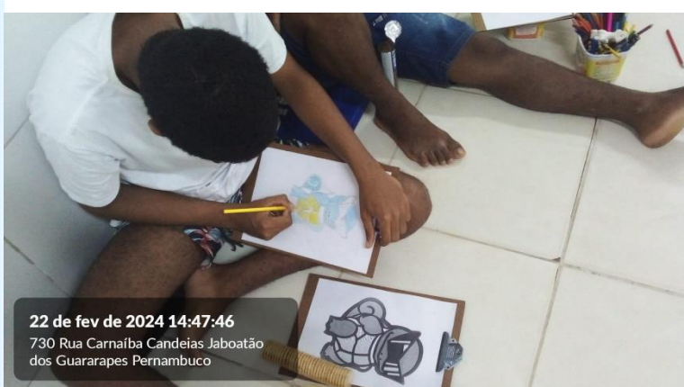
22 de fev de 2024 14:47:46 730 Rua Carnalba Candeias Jaboatão dos Guararapes Pernambuco