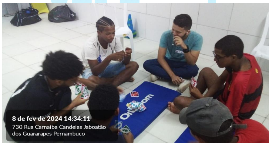
8 de fev de 2024 14:34:11 730 Rua Carnalba Candeias Jaboatão dos Guararapes Pernambuco