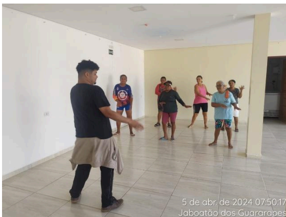
5 de abr. de 2024 07:50:17 Jaboatão dos Guararapes