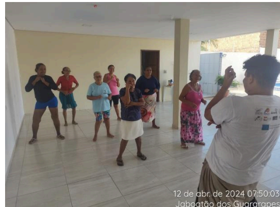
12 de abr. de 2024 07:50:03 Jaboatão dos Guararapes