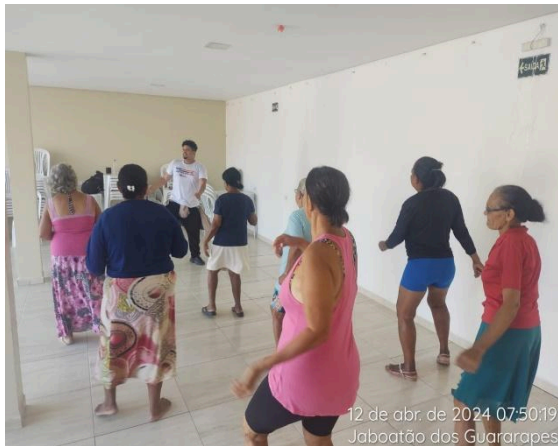
12 de abr. de 2024 07:50:19 Jaboatão dos Guararapes