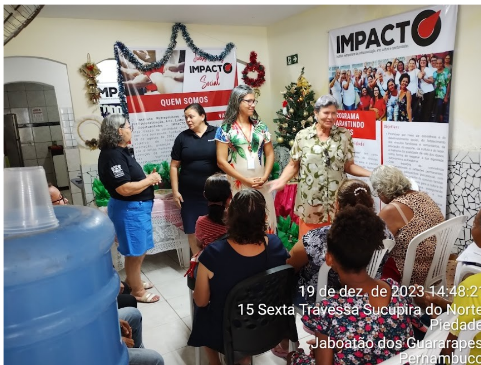
19 de dez. de 2023 14:48:21 15 Sexta Travessa Sucupira do Norte Piedade Jaboatão dos Guararapes Pernambuco