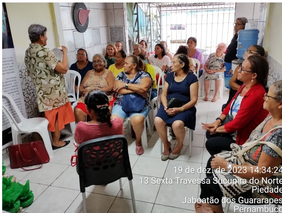
19 de dez. de 2023 14:34:24 13 Sexta Travessa Sucupira do Norte Piedade Jaboatão dos Guararapes Pernambuco