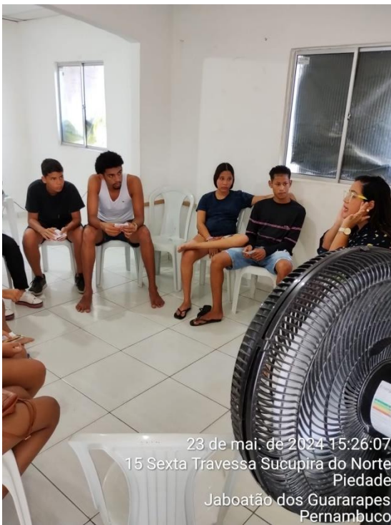
23 de mai. de 2024 15:26:07 15 Sexta Travessa Sucupira do Norte Piedade Jaboatão dos Guararapes Pernambuco