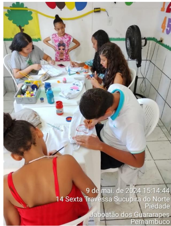
9 de mai. de 2024 15:14:44 14 Sexta Travessa Sucupira do Norte Piedade Jaboatão dos Guararapes Pernambuco