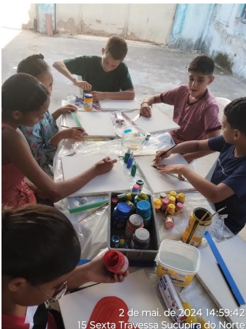
2 de mai. de 2024 14:59:42 15 Sexta Travessa Sucupira do Norte