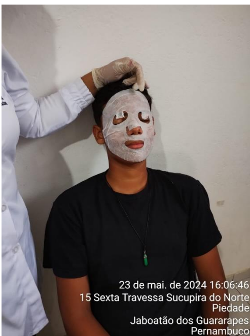
23 de mai. de 2024 16:06:46 15 Sexta Travessa Sucupira do Norte Piedade Jaboatão dos Guararapes Pernambuco