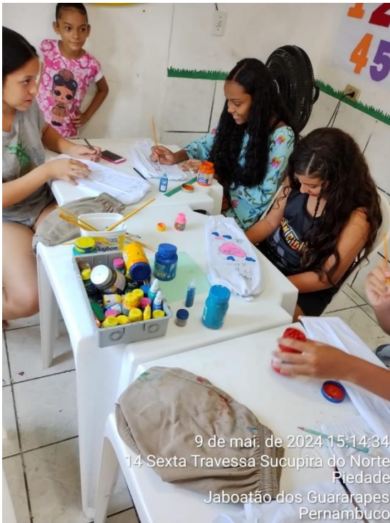
9 de mai. de 2024 15:14:34 14 Sexta Travessa Sucupira do Norte Piedade Jaboatão dos Guararapes Pernambuco