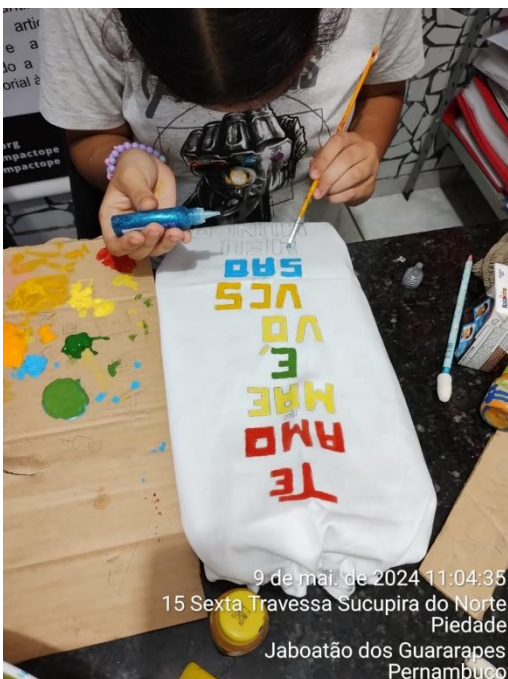
9 de mai. de 2024 11:04:35 15 Sexta Travessa Sucupira do Norte Piedade Jaboatão dos Guararapes Pernambuco