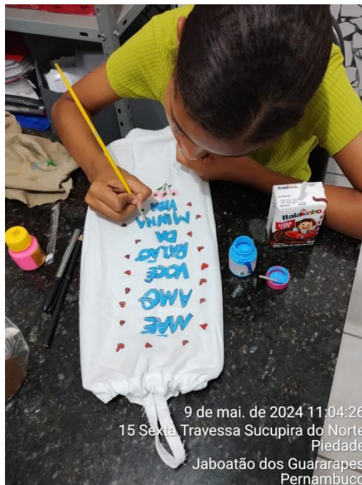
9 de mai. de 2024 11:04:26 15 Sexta Travessa Sucupira do Norte Piedade Jaboatão dos Guararapes Pernambuco