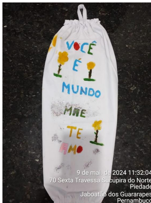
9 de mai. de 2024 11:32:04 70 Sexta Travessa Sucupira do Norte Piedade Jaboatão dos Guararapes Pernambuco