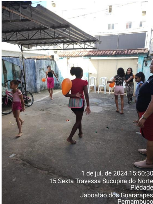
1 de jul. de 2024 15:50:30 15 Sexta Travessa Sucupira do Norte Piedade Jaboatão dos Guararapes Pernambuco