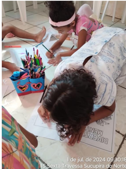
1 de jul. de 2024 09:30:18 15 Sexta Travessa Sucupira do Norte