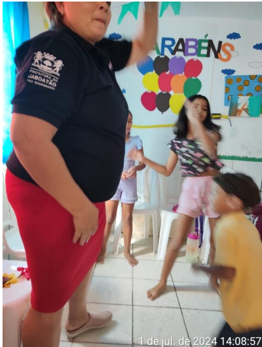
1 de jul. de 2024 14:08:57