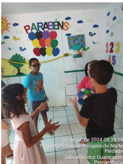
10 de jul. de 2024 09:39:19 14 Sexta Travessa Sucupira do Norte Piedade Jaboatão dos Guararapes Pernambuco