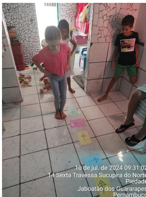
10 de jul. de 2024 09:31:02 14 Sexta Travessa Sucupira do Norte Piedade Jaboatão dos Guararapes Pernambuco