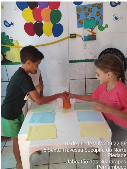
10 de jul. de 2024 09:22:56 15 Sexta Travessa Sucupira do Norte Piedade Jaboatão dos Guararapes Pernambuco