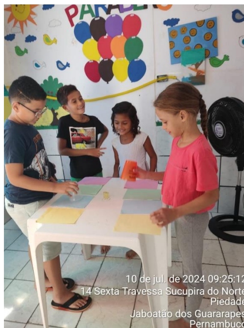
10 de jul. de 2024 09:25:12 14 Sexta Travessa Sucupira do Norte Piedade Jaboatão dos Guararapes Pernambuco