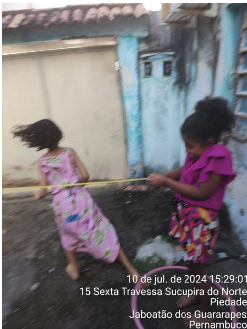
10 de jul. de 2024 15:29:01 15 Sexta Travessa Sucupira do Norte Piedade Jaboatão dos Guararapes Pernambuco