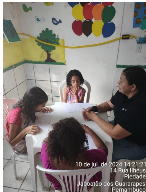
10 de jul. de 2024 14:21:21 14 Rua Ilhéus Piedade Jaboatão dos Guararapes Pernambuco