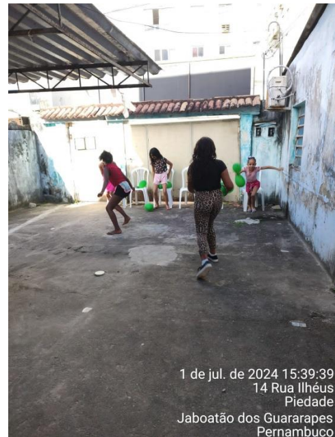
1 de jul. de 2024 15:39:39 14 Rua Ilhéus Piedade Jaboatão dos Guararapes Pernambuco