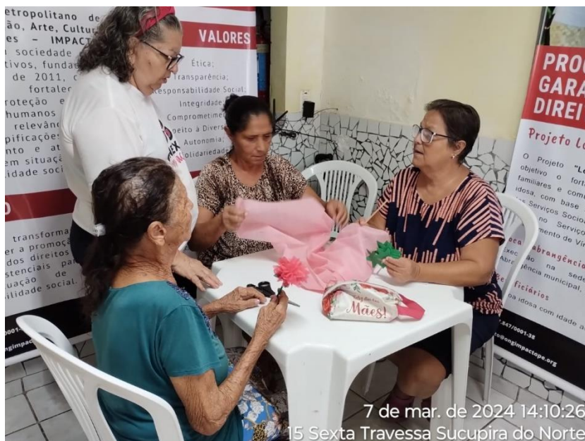
7 de mar. de 2024 14:10:26 15 Sexta Travessa Sucupira do Norte