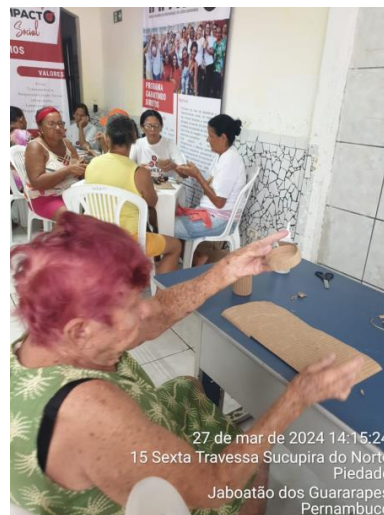
27 de mar de 2024 14:15:24 15 Sexta Travessa Sucupira do Norte Piedade Jaboatão dos Guararapes Pernambuco