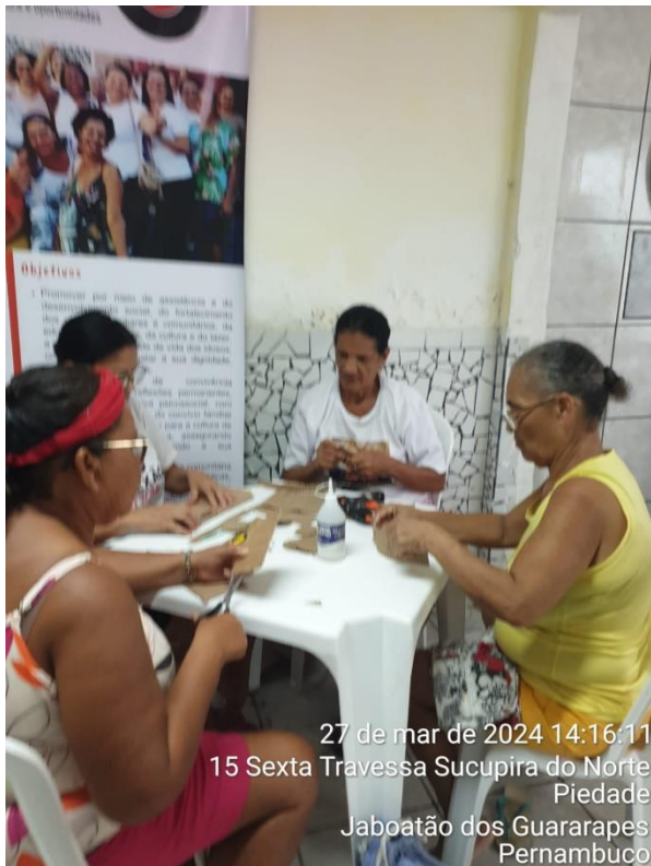
27 de mar de 2024 14:16:11 15 Sexta Travessa Sucupira do Norte Piedade Jaboatão dos Guararapes Pernambuco