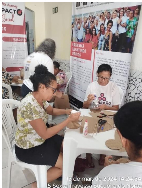
13 de mar. de 2024 14:24:34 15 Sexta Travessa Sucupira do Norte