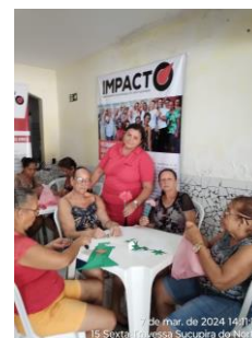
7 de mar. de 2024 14:11:13 15 Sexta Travessa Sucupira do Norte