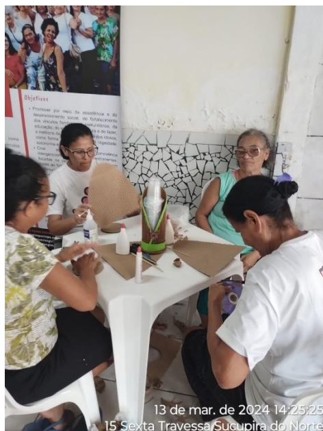
13 de mar. de 2024 14:25:25 15 Sexta Travessa Sucupira do Norte