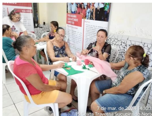
7 de mar. de 2024 14:10:13 15 Sexta Travessa Sucupira do Norte