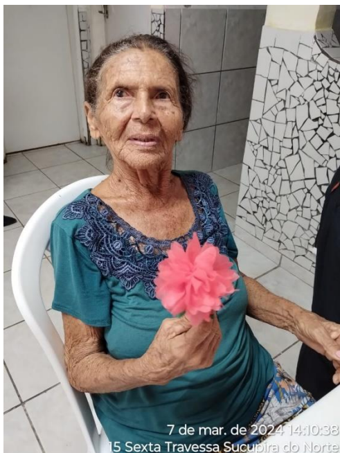
7 de mar. de 2024 14:10:38 15 Sexta Travessa Sucupira do Norte