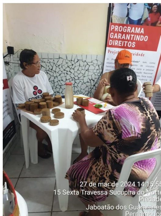
27 de mar de 2024 14:15:55 15 Sexta Travessa Sucupira do Norte Piedade Jaboatão dos Guararapes Pernambuco