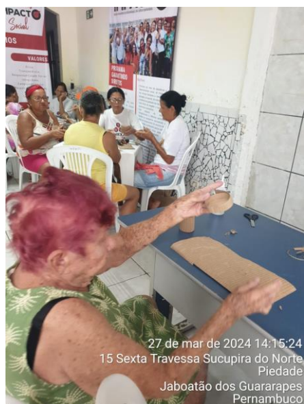
27 de mar de 2024 14:15:24 15 Sexta Travessa Sucupira do Norte Piedade Jaboatão dos Guararapes Pernambuco