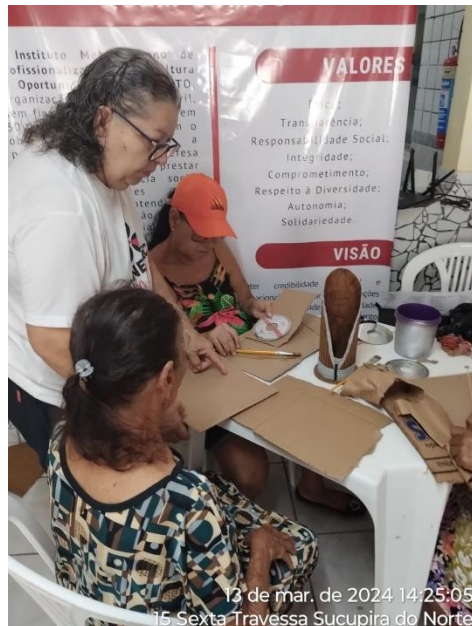
13 de mar. de 2024 14:25:05 15 Sexta Travessa Sucupira do Norte